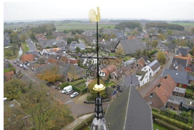
Anjum oktober 2013

restauratie-renovatie-nieuwbouw-verbouw-onderhoud